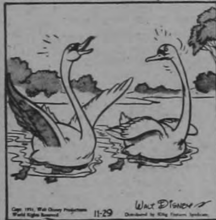
—Me siento tan gracioso como un cisne de dibujo.